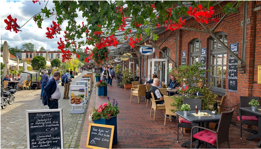
Schaufenster Fischereihafen IMG_0644 (c) Tanja Mehl_Erlebnis Bremerhaven.JPG - © Tanja Mehl_Erlebnis Bremerhaven