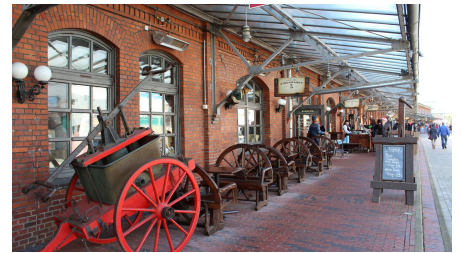
Schaufenster Fischereihafen Fischparty 134 (c) Tanja Mehl_Erlebnis Bremerhaven.JPG - © Tanja Mehl_Erlebnis Bremerhaven