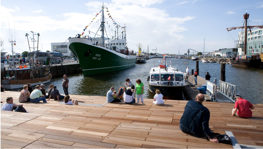
Schaufenster Fischereihafen - © Martine Buchholz_Erlebnis Bremerhaven

Freizeitinfrastruktur, Mobilität und Service sonstige