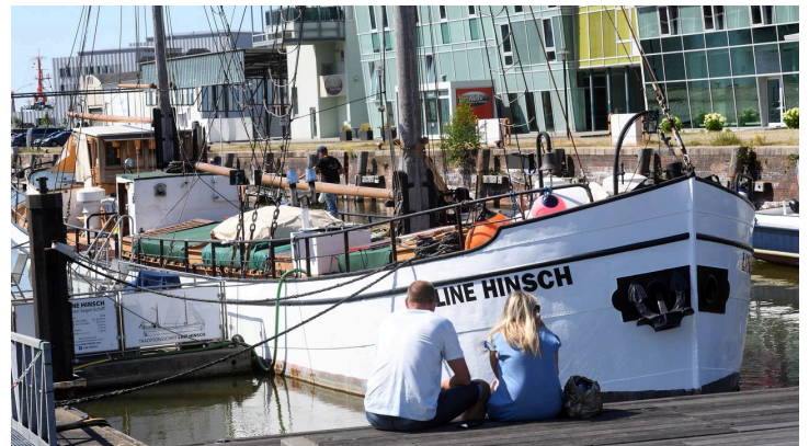
24.6.20 Erlebnis17 (c) Wolffhard Scheer_Erlebnis Bremerhaven.JPG - © Wolffhard Scheer_Erlebnis Bremerhaven