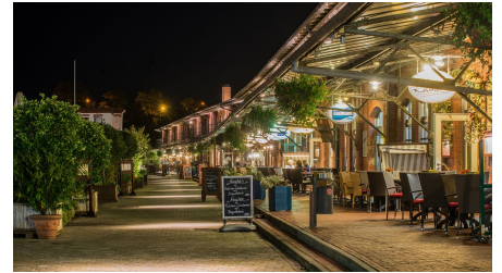
Schaufenster Fischereihafen 0930 3_filtered.jpg