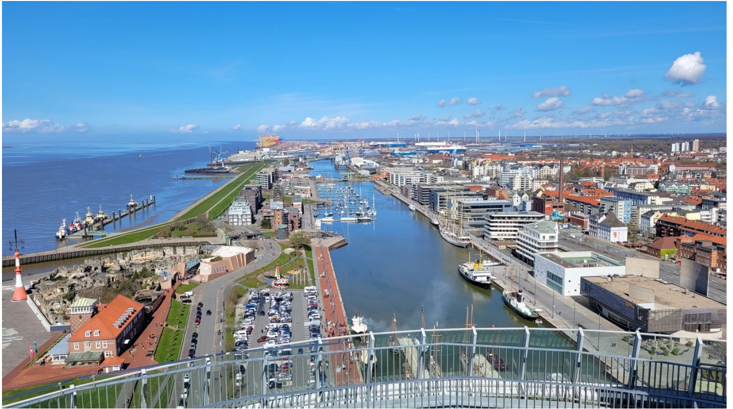
Blick von der Aussichtsplattform Sail City auf die Havenwelten