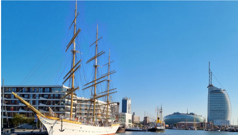
Havenwelten (c) Tanja Tiedemann_Erlebnis Bremerhaven_Ausschnitt.jpg - © Tanja Tiedemann_Erlebnis Bremerhaven