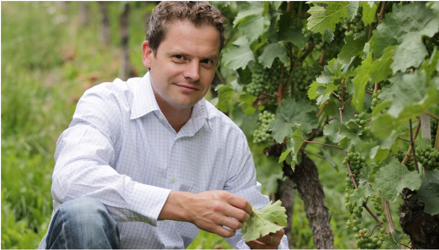
neues Bild Weingut Alexander Laible