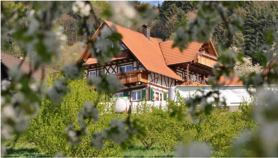
idyllisch - der Winzerhof Doll in Kappelrodeck