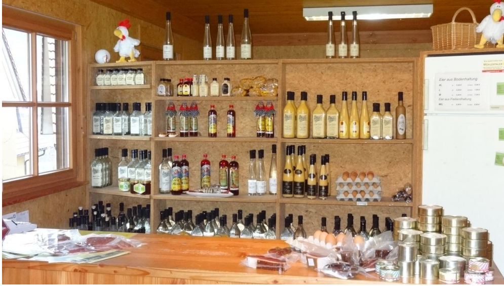
Hofläde Schnurrenhof