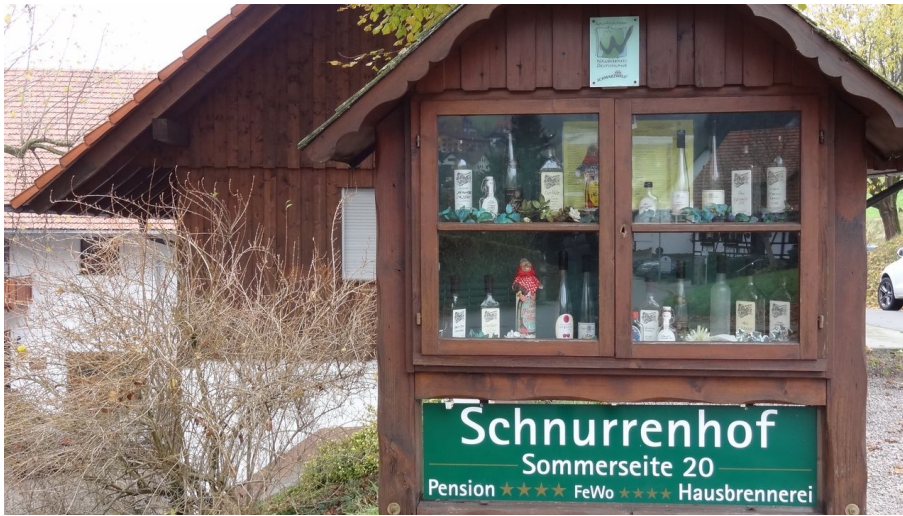
Hofladen und Brennerei Schnurrenhof