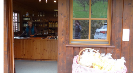
Hoflädele Schnurrenhof