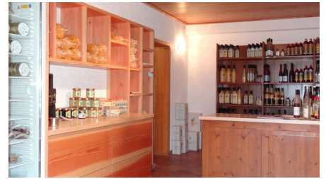
Hoflädele Schnurrenhof - © Nationalparkregion Schwarzwald - Achertal, Tourist-Info. Seebach - Manuela Epting