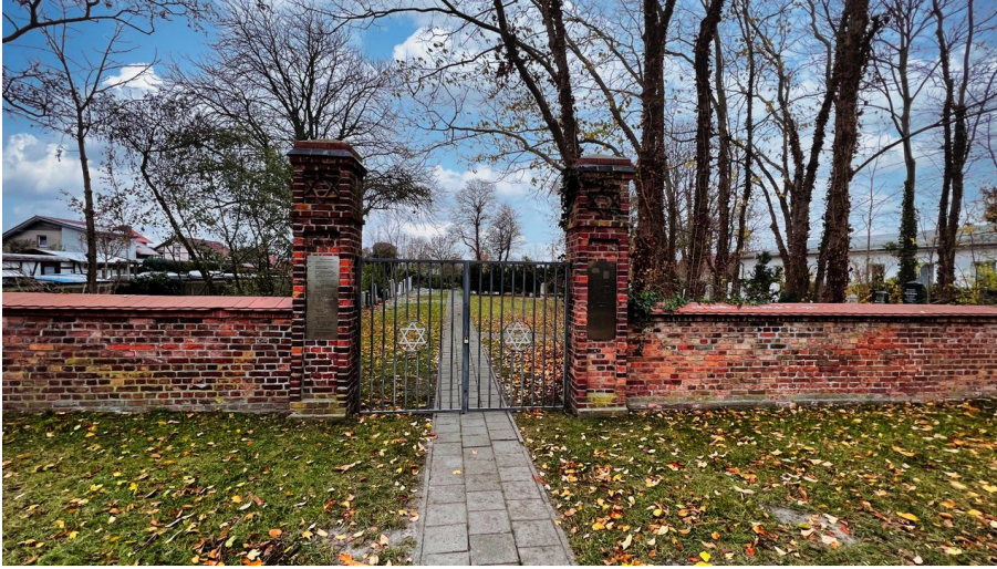
Jüdischer Friedhof