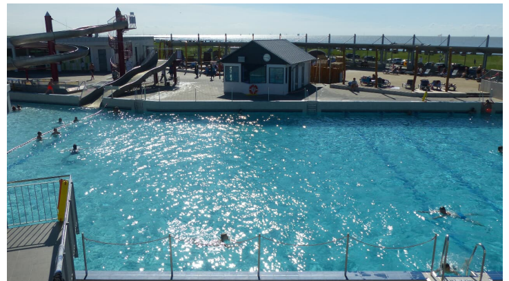
Watt'n Bad