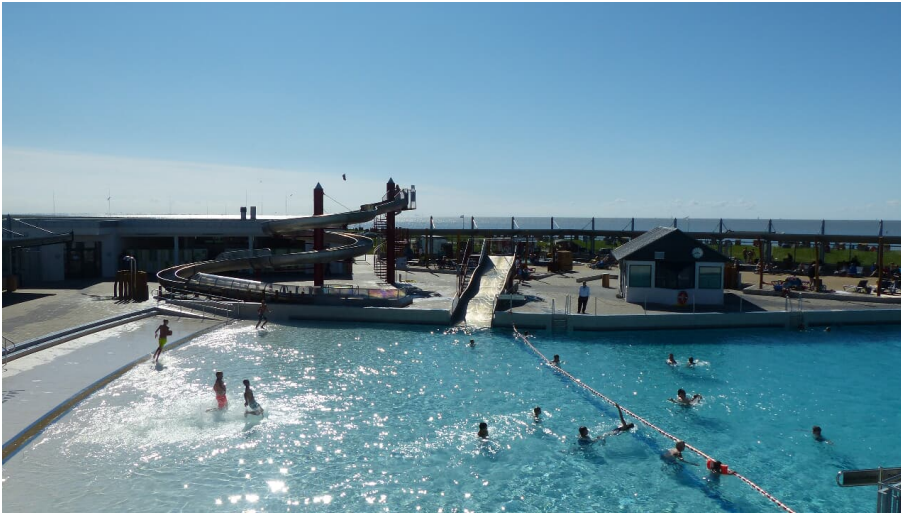
Watt'n Bad - © Kurverwaltung Wurster Nordseeküste