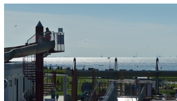
Watt'n Bad