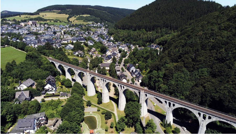
Viadukt von oben - Willingen