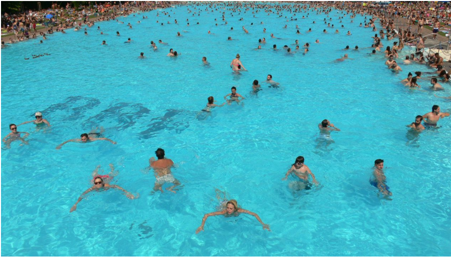
Freibad Brentano