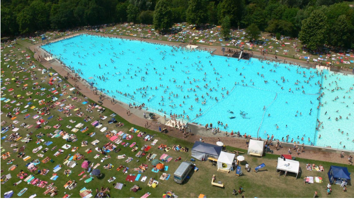
Freibad Brentano von oben