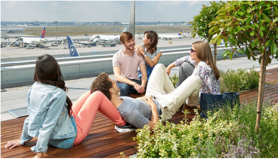
Besucherterrasse Frankfurt Airport