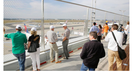
Besucherterrasse Fraport