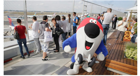
Besucherterrasse Fraport - © Fraport AG