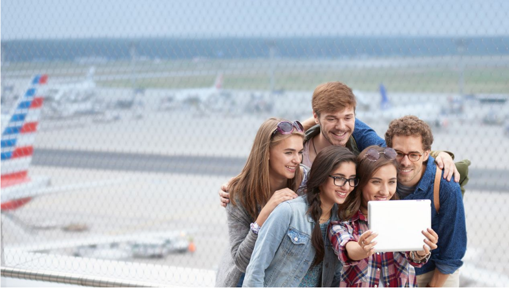
Junge Leute auf der Besucherterrasse Fraport