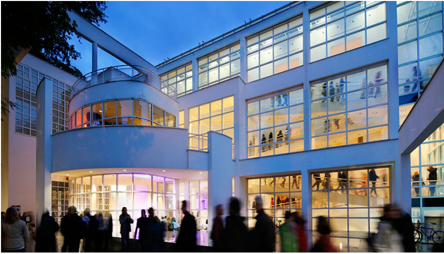
Museum für Angewandte Kunst - © Anja Jahn