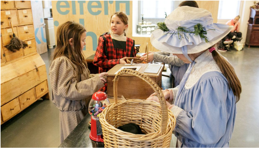
Junges Museum Frankfurt Kolonialwarenladen