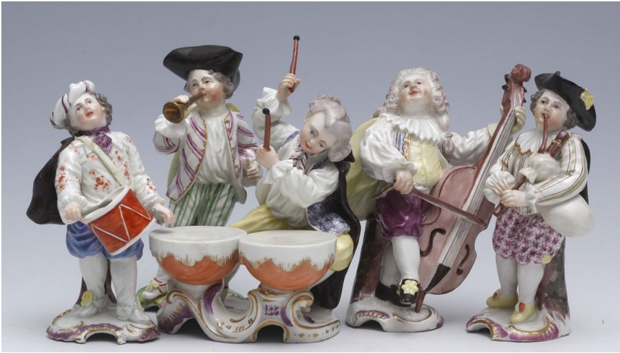
Porzellan Museum Skulptur

Die Dauerausstellung umfasst drei große Abteilungen: die "Städtische Sammlung", die "Stiftung Bechtold" sowie "Höchste Güte und barocke Zier". Die Althöchster Reproduktionen in "Passauer Porzellan" sind im Bolongaropalast ausgestellt.