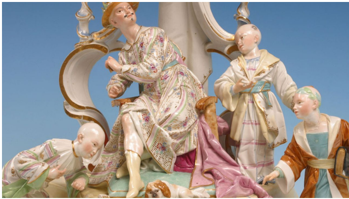
Porzellan Museum Detail

Sonntag, 11.08.2024, 11:00 - 18:00 Uhr Samstag, 17.08.2024, 11:00 - 18:00 Uhr Sonntag, 18.08.2024, 11:00 - 18:00 Uhr Samstag, 24.08.2024, 11:00 - 18:00 Uhr Sonntag, 25.08.2024, 11:00 - 18:00 Uhr Samstag, 31.08.2024, 11:00 - 18:00 Uhr Sonntag, 01.09.2024, 11:00 - 18:00 Uhr Samstag, 07.09.2024, 11:00 - 18:00 Uhr Sonntag, 08.09.2024, 11:00 - 18:00 Uhr Samstag, 14.09.2024, 11:00 - 18:00 Uhr Sonntag, 15.09.2024, 11:00 - 18:00 Uhr Samstag, 21.09.2024, 11:00 - 18:00 Uhr Sonntag, 22.09.2024, 11:00 - 18:00 Uhr Samstag, 28.09.2024, 11:00 - 18:00 Uhr Sonntag, 29.09.2024, 11:00 - 18:00 Uhr [...]