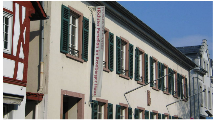
Porzellan Museum Frankfurt Außenansicht