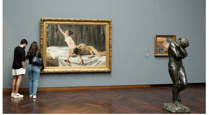
Frankfurt_Städel Museum_1041158_©#visitfrankfurt_Isabela_Pacini.jpg - © #visitfrankfurt_plazy_Isabela_Pacini