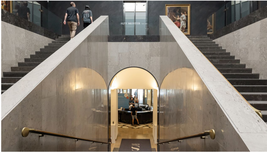
Frankfurt_Städel Museum_1041207_©#visitfrankfurt_Isabela_Pacini (1).jpg - © #visitfrankfurt_plazy_Isabela_Pacini