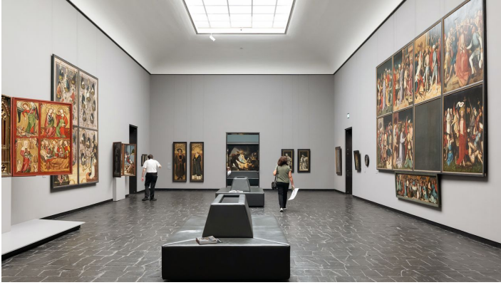
Frankfurt_Städel Museum_1041185_©#visitfrankfurt_Isabela_Pacini.jpg