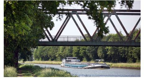
Lübbecke Mittellandkanal Oliver Krato - © Oliver Krato