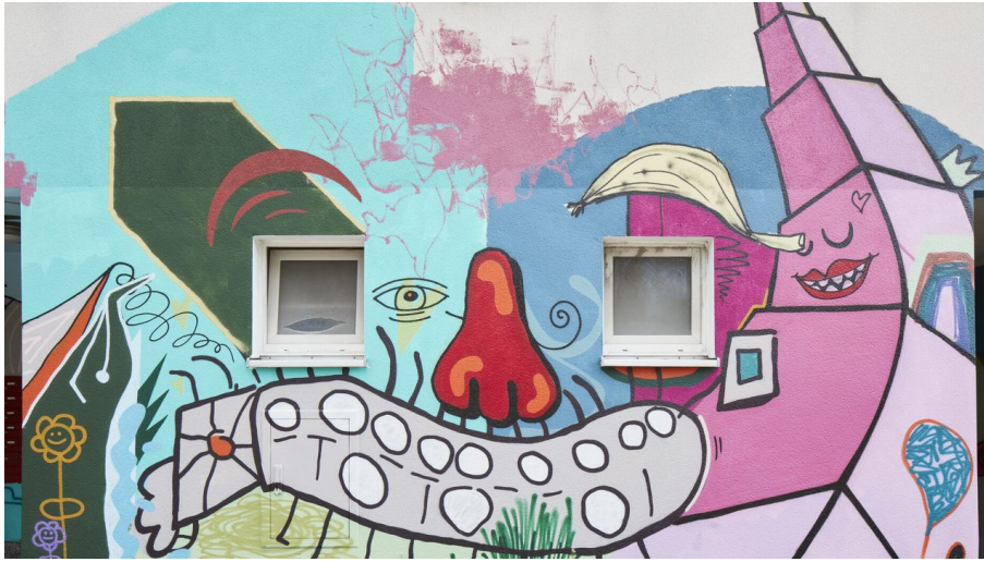
cdw Stiftung; Foto: Nicolas Wefers