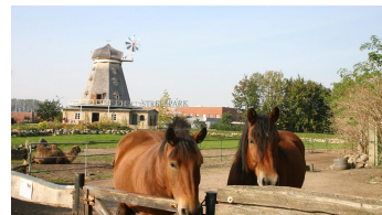
Pferde im Zoo Stralsund