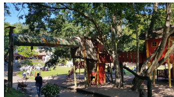
Spielplatz Zoo Stralsund