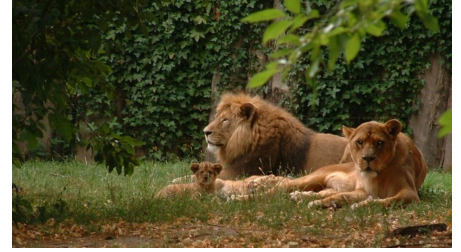
Löwen im Zoo Stralsund