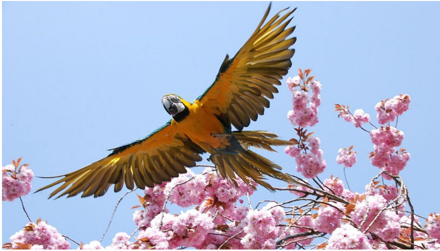
fliegender Ara Stralsunder Zoo