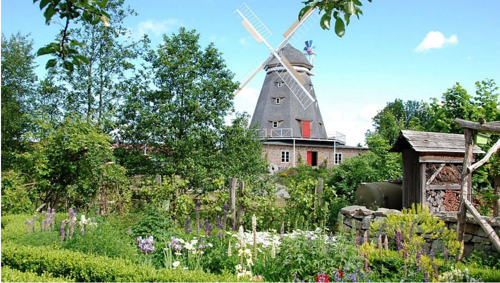
Holländerwindmühle Zoo Stralsund