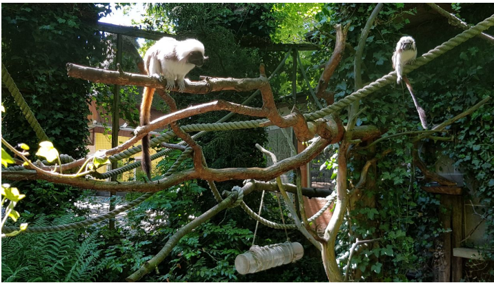
Zwergaffen im Zoo Stralsund