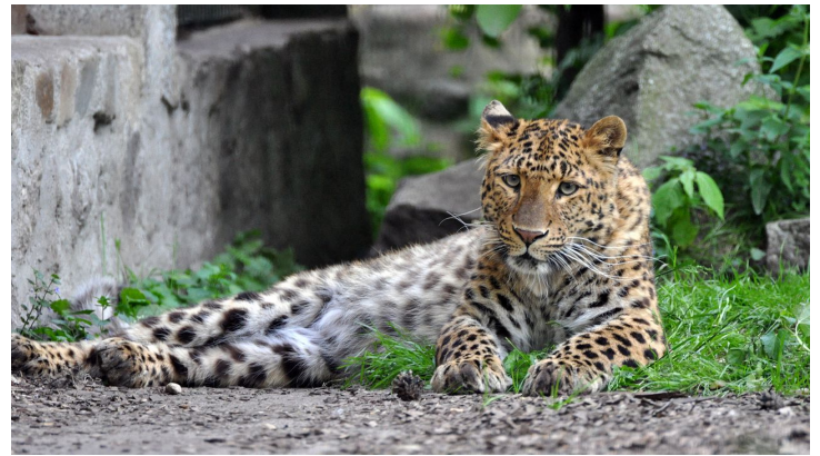
Leopard im Zoo Stralsund