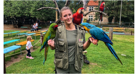
Flugshow im Zoo Stralsund