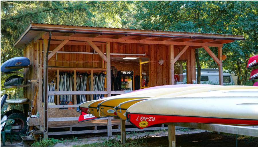
Mietstation Schaalsee-Camp