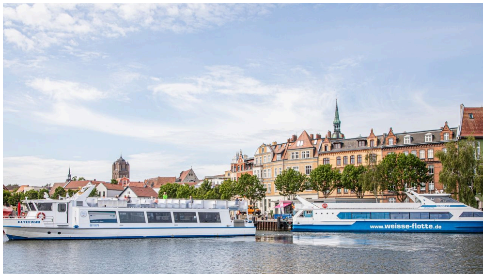
Weißer Flotte

Die Fährlinie zwischen dem Seebad Warnemünde und dem Ortsteil Hohe Düne ist der bequemste und schnellste Weg, um von Warnemünde z.B. zum Strand nach Markgrafenheide, zum Yachthafen, in die Rostocker Heide, oder auf kürzesten Weg auf den Darss oder nach Stralsund zu gelangen. Auf der kurzen Fährfahrt genießen Sie das Flair inmitten der großen Fähren, Frachter sowie der am Passagierkai liegenden Kreuzfahrtschiffe.