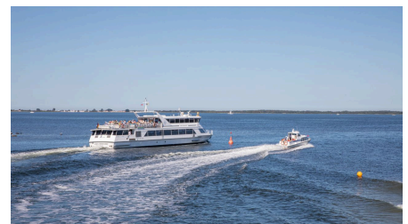
Fähre nach Hiddensee