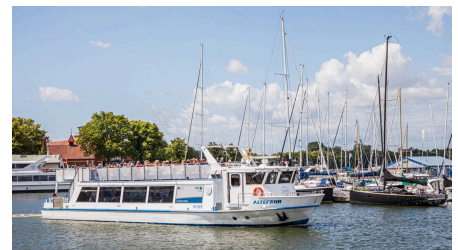
Weißer Flotte