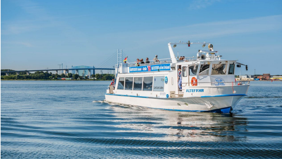
Weißer Flotte Hafenrundfahrt