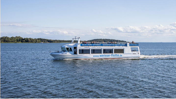
Weisse Flotte