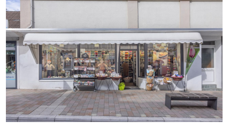
Lana Grossa_3 - © Barbara Meinhardt Bielefeld Goerdelerstraß 1a