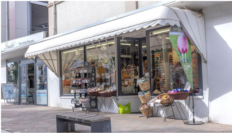
Lana Grossa_1