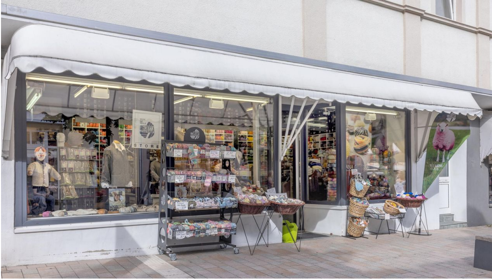
Lana Grossa_2