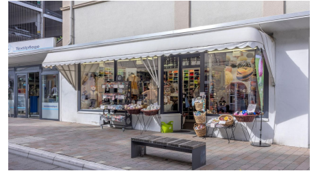
Lana Grossa_4 - © Barbara Meinhardt Bielefeld Goerdelerstraß 1a