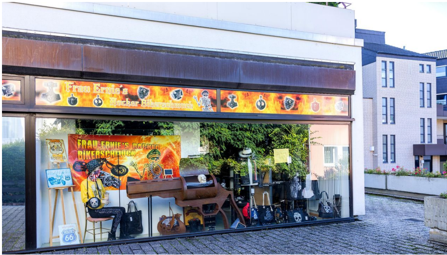
Frau Ernie's Bikerschmuck_1