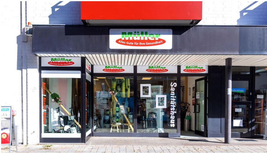
Sanitätshaus Müller_1