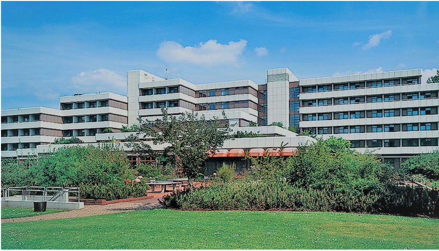
Klinik am Lietholz