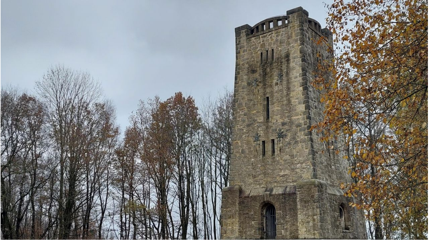
Bismarckturm Bad Salzungen