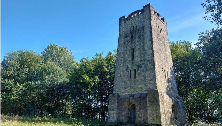
Bad Salzufler Bismarckturm