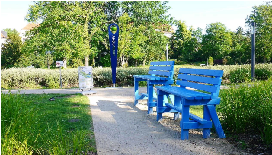
Aktiv-Fläche im Kurpark