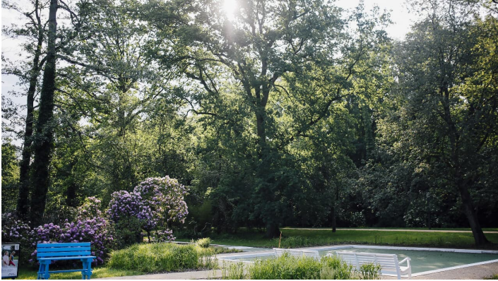
Aktiv-Fläche Kurpark - © Stadt Bad Salzuflen/S. Strothbäumer