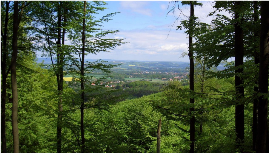
Aussicht vom Kamm des Teutoburger Waldes