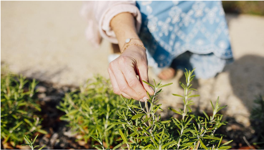
Kneipp Kräutergarten