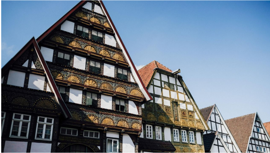
Historische Altstadt Salzuflen