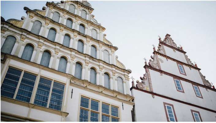
Häuserfassaden Bad Salzungen