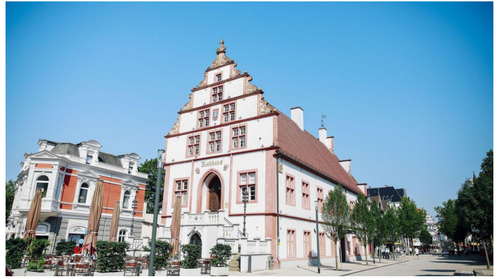
Historische Altstadtaufnahme