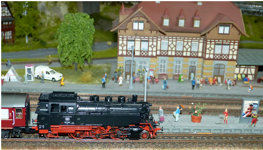
Bahnhof_MoBaZa(c)Modellbahnzauber.jpg - © (c) Petra Blume