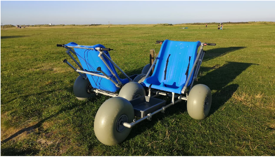
POI_Wattmobil_Schillig_WTG_.jpg - © Wangerland Touristik GmbH

Sport, Freizeit und Aktivitäten sonstige