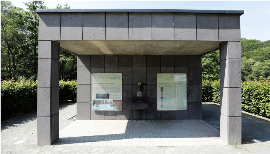
Bad Endbach - Trinkbrunnen - © Heiko Rhode