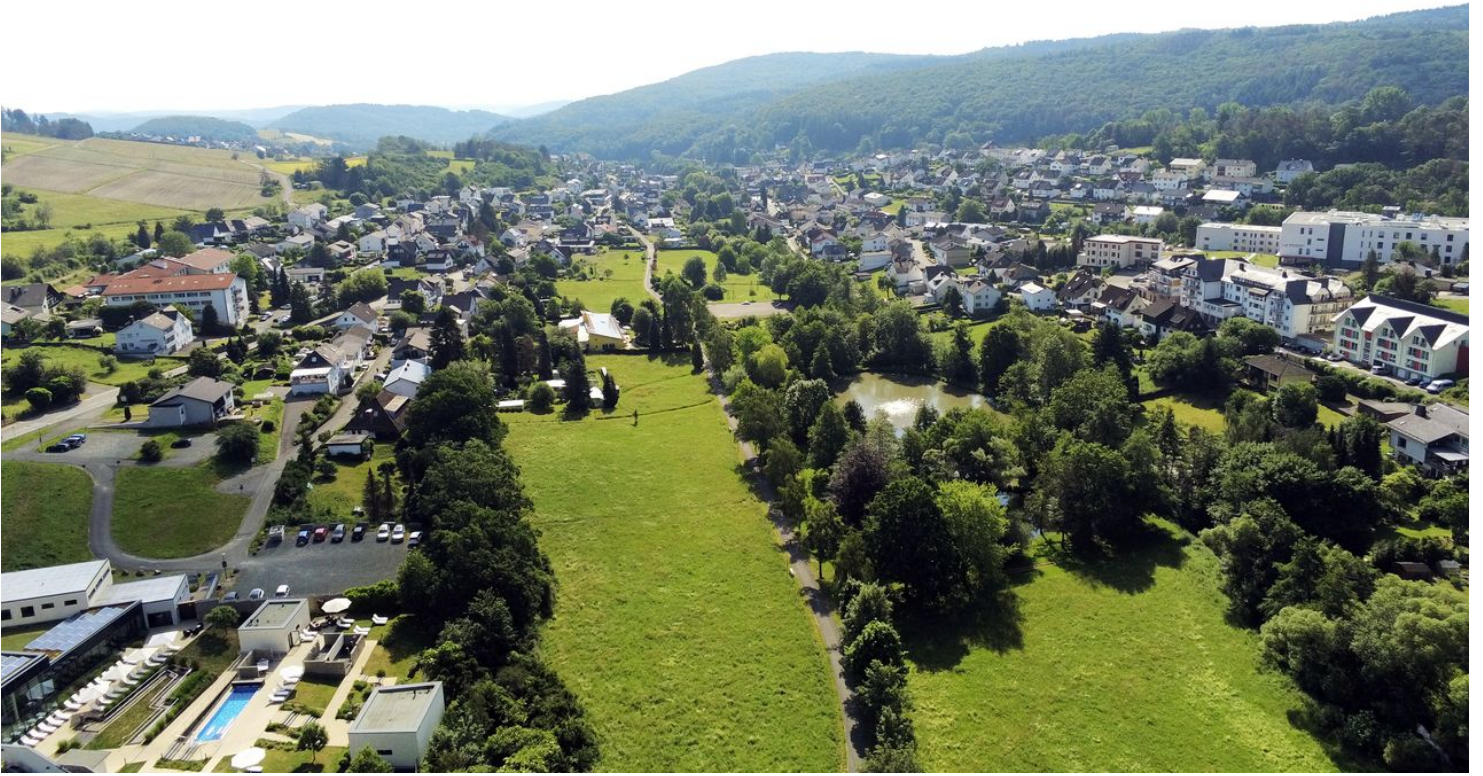
Bad Endbach - von oben