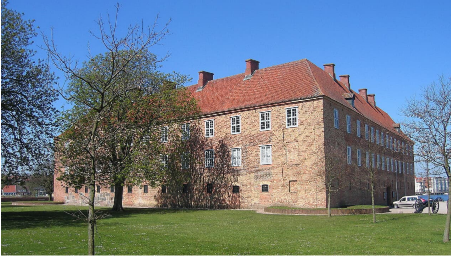
Museum Schloss Sønderborg - © Sønderborg Slot, Museum Sønderjylland