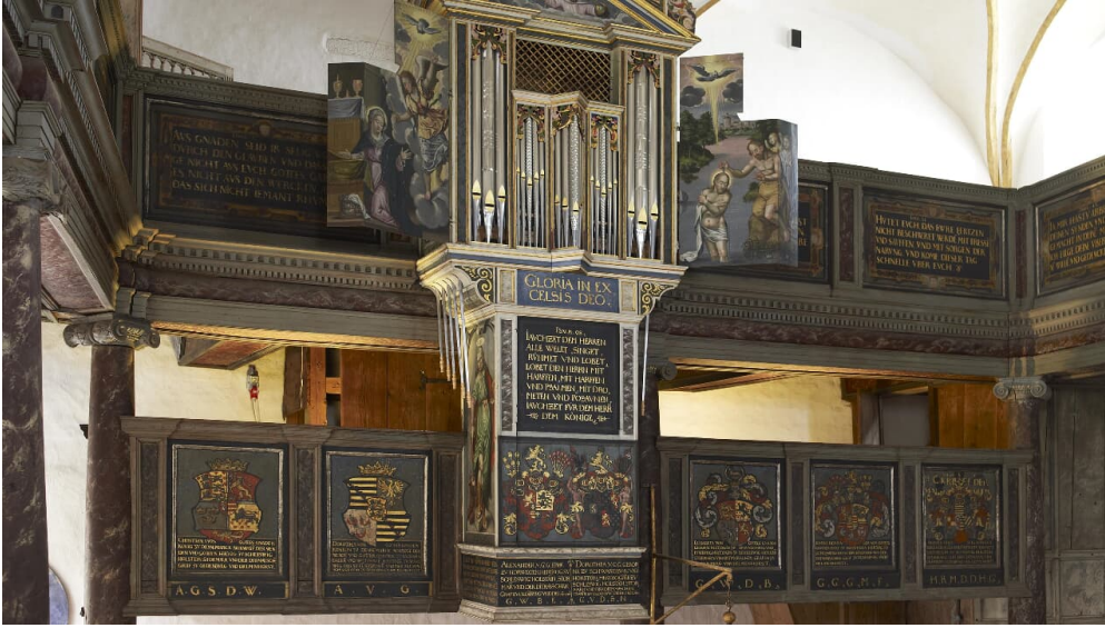
Schloss Sønderborg Kapelle