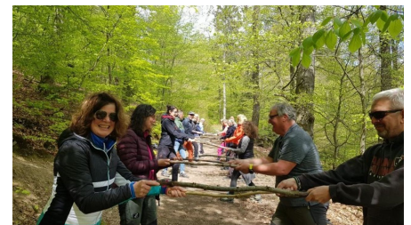
Gesundheitswandern Gruppenbild