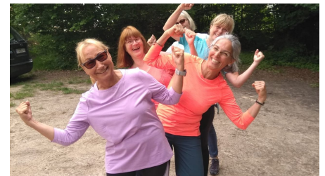
Gesundheitswandern Gruppe 2