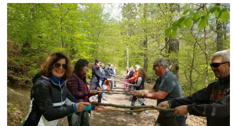
Gesundheitswandern Gruppenbild