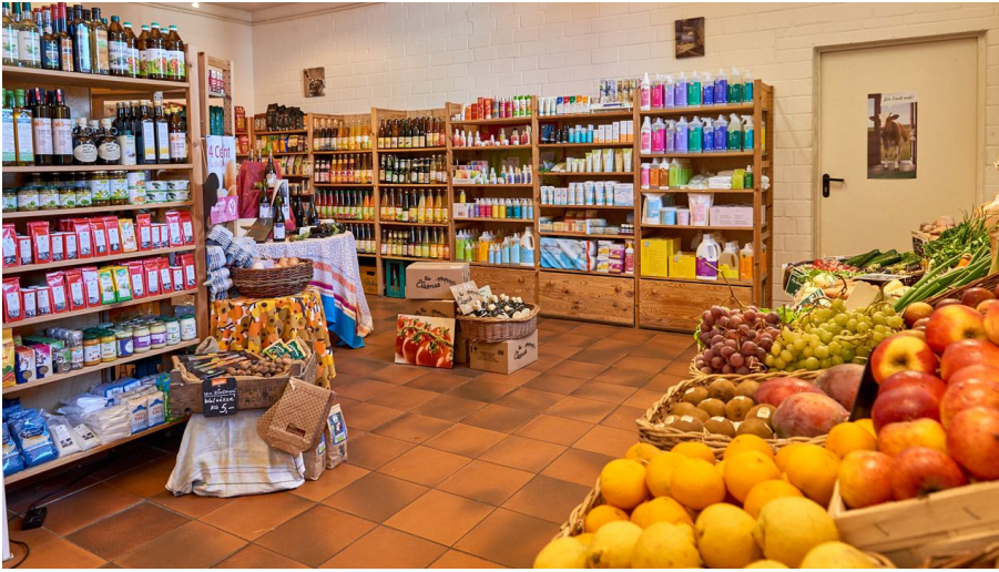
Die Käserei auf dem Demeter-Bauernhof in Heiningen