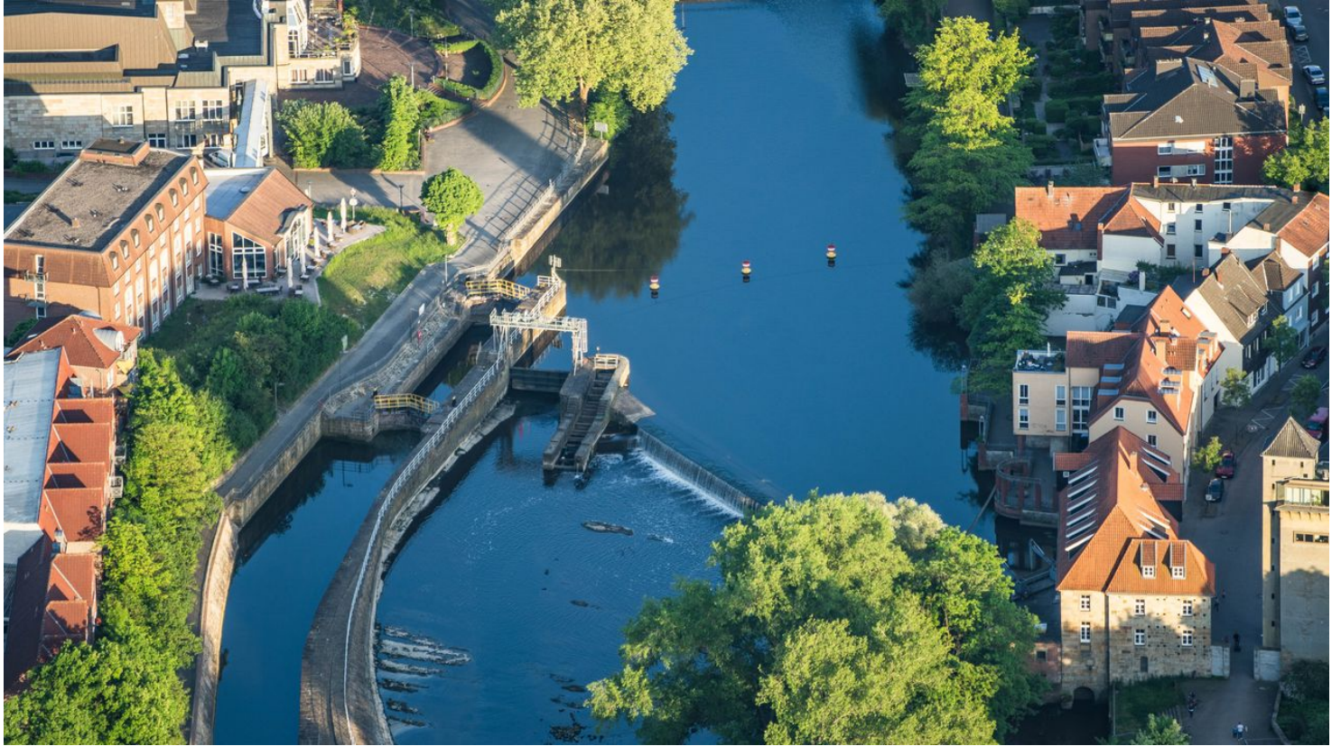
Rheine_Emswehr aus der Luft_Foto_Rheine Tourismus Veranstaltungen eV.jpg