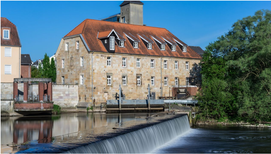
Rheine_Emswehr 2.jpg