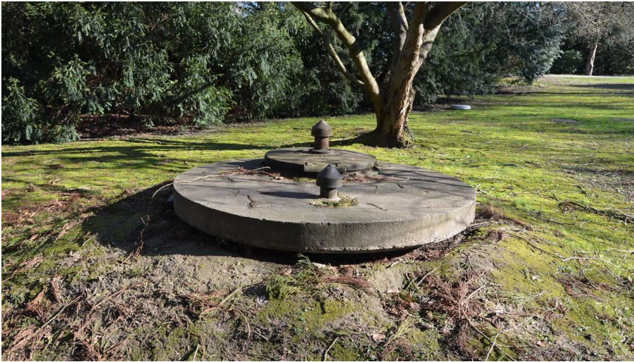
Wittekind II - © Staatsbad GmbH