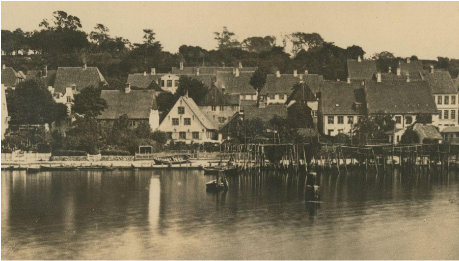
Blick auf Jürgensby um 1881