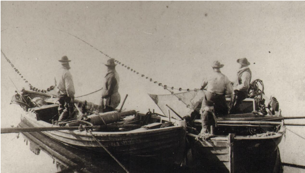
Fischer auf der Flensburger Förde, um 1900