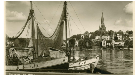
Hafen Ansichtskarte