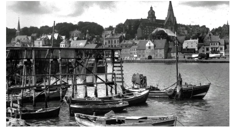
Fischereihafen, 1930er Jahre