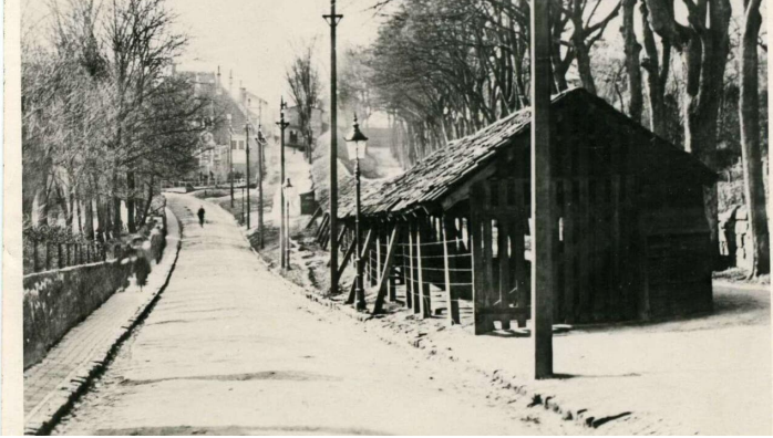
die überdachte Reepschlägerbahn