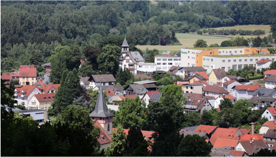
Bad König - von oben - © Heiko Rhode