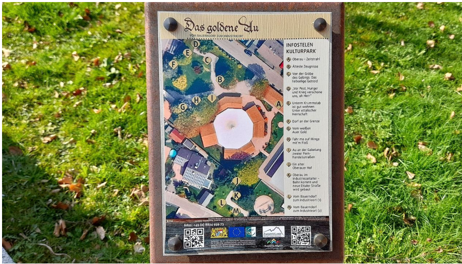
Das goldene Au