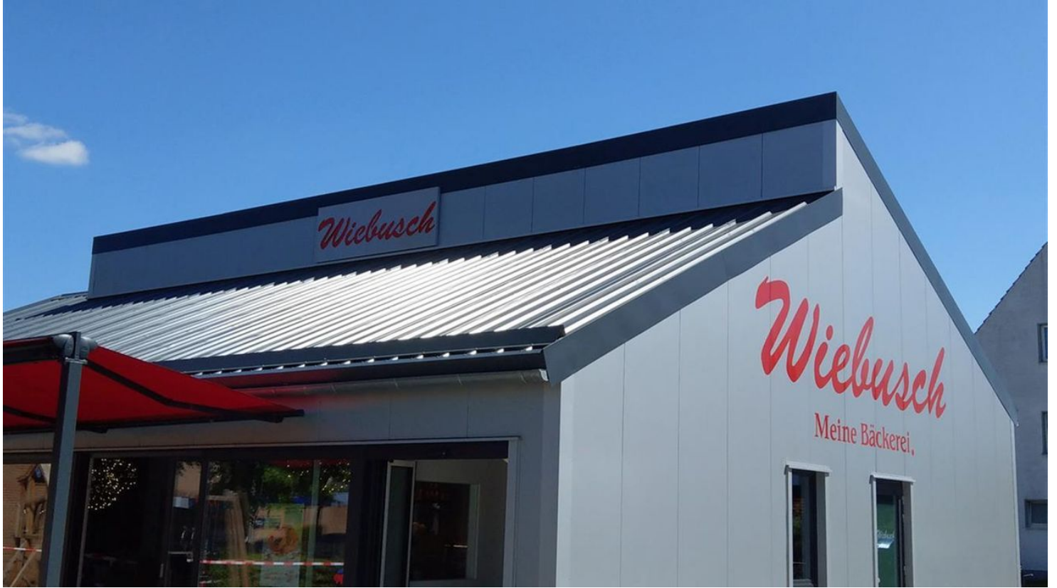
Bielefelder 21 hoch