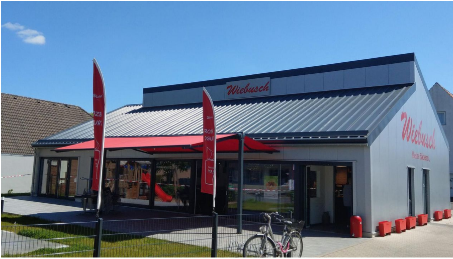
Bielefelder Straße 21 quer