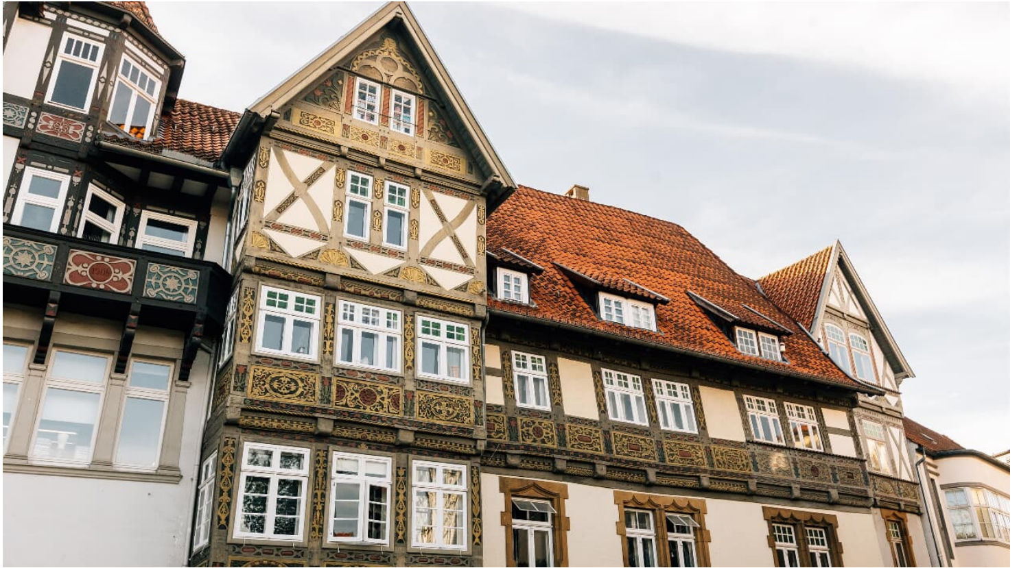
Haus an der Steege Detailansicht