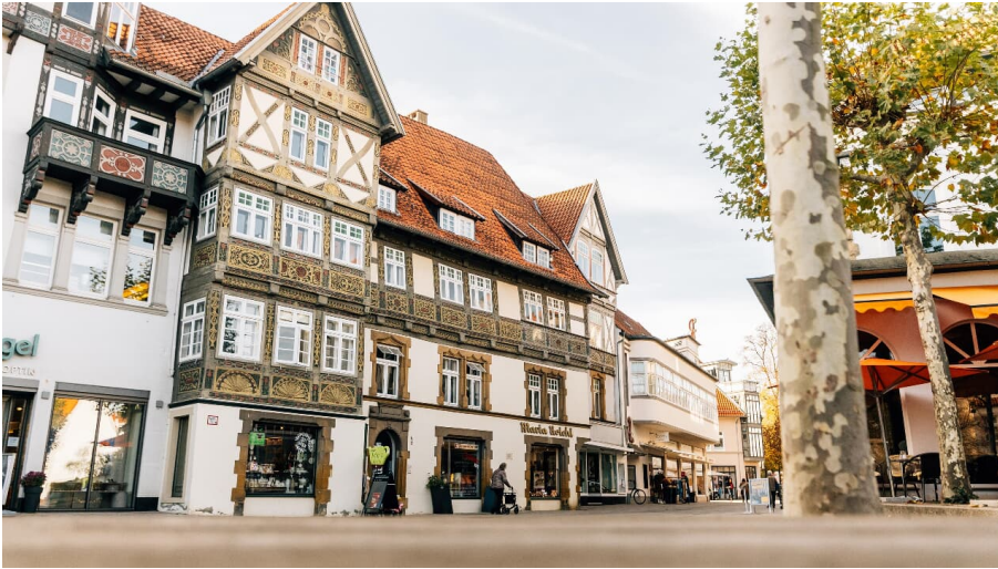
Haus an der Steege