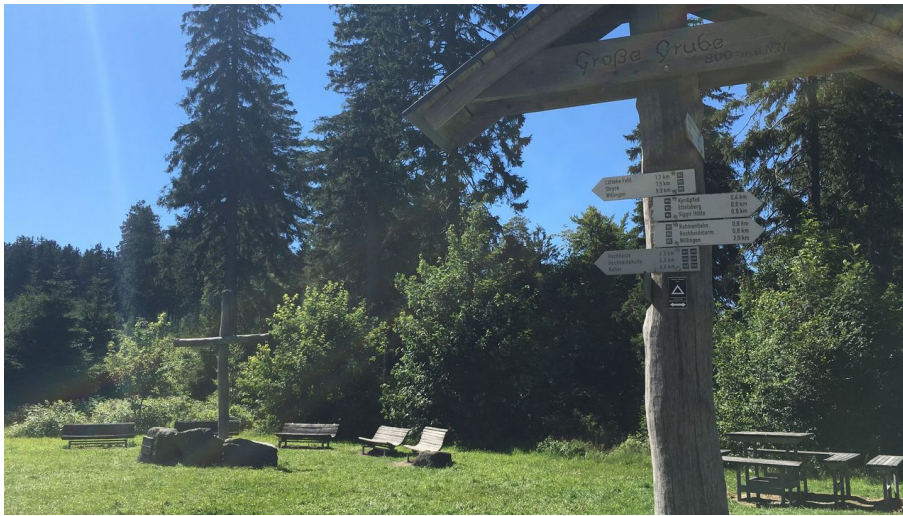
Große Grube Willingen c) Sophia Beyer.jpg