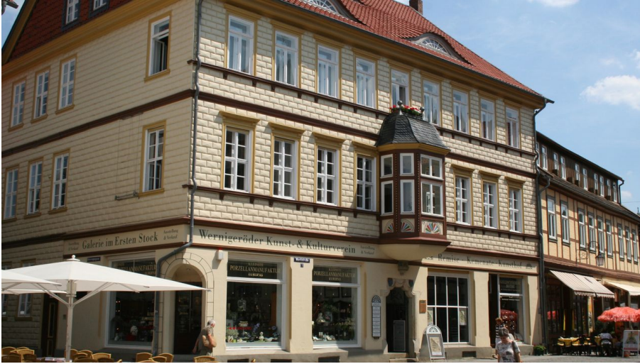
Frie Juli 2008 2 012.jpg