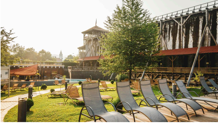
Saunagarten mit integriertem Gradierwerk

Mo. - Do. u. Sa. 9:30 bis 22:00 Uhr Freitag 9:30 bis 23:00 Uhr Sonntag 9:30 bis 21:00 Uhr Damensauna mittwochs ab 17:30 Uhr Auch an Feiertagen geöffnet