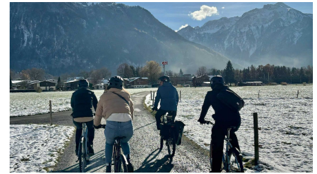
yello-velo-winter-bike-tour-unterwegs.jpg