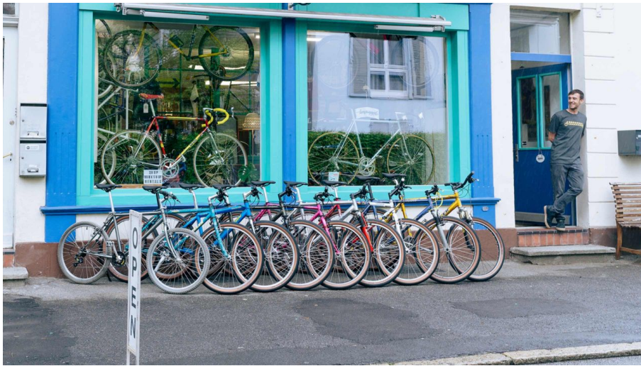
yello-velo-vintage-fahrrad-verleih-bikes-vor-geschaef.jpg