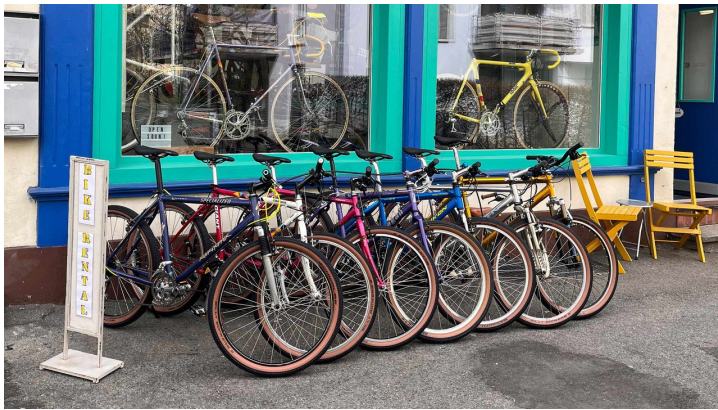
yello-velo-vintage-fahrrad-verleih-geschaef-bikes.jpg