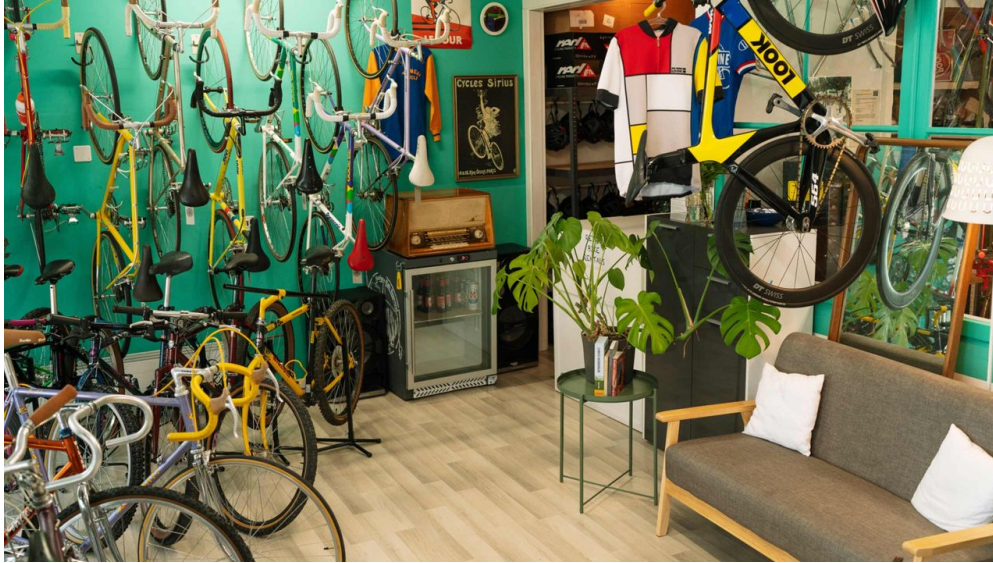
yello-velo-vintage-fahrrad-verleih-bikes-im-geschaef.jpg