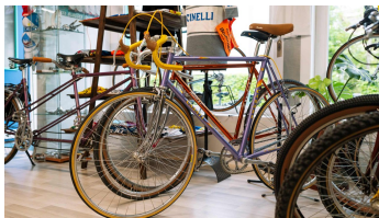
yello-velo-vintage-fahrrad-verleih-rennrad-geschaef.jpg