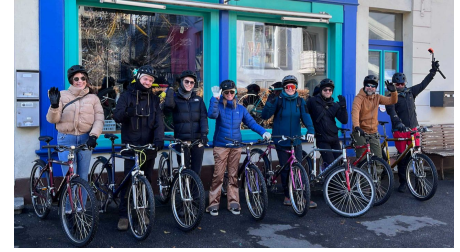
yello-velo-winter-bike-tour-gruppe.jpg