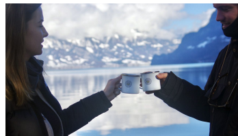
yello-velo-winter-bike-tour-getraenk.jpg