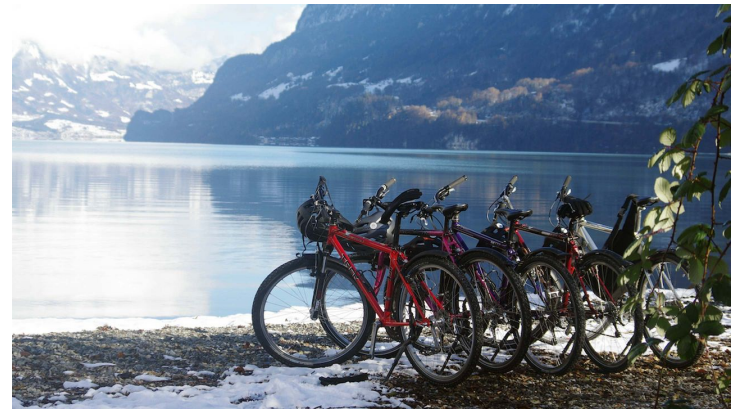
yello-velo-winter-bike-tour-brienzersee.jpg