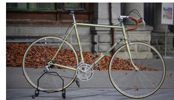
yello-velo-vintage-fahrrad-verleih-interlaken-gruen.jpg