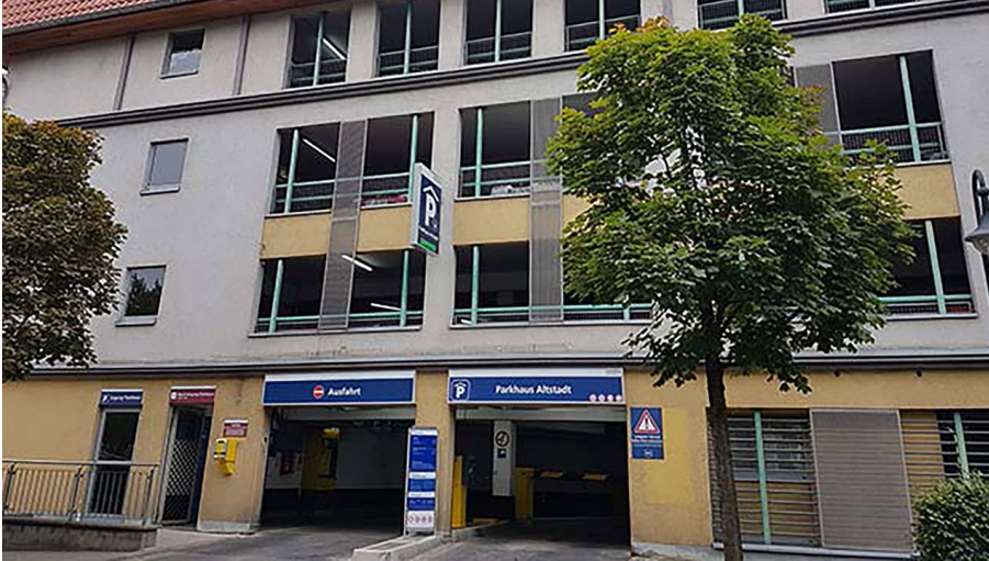
Parkhaus-Altstadt-in-Wernigerode-(c)contipark - © Interconti - Interparking Group