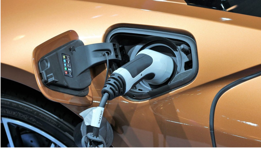
E-Lade Station