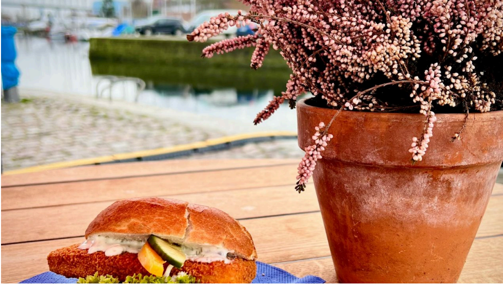
Fischkutter Flipper