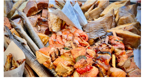
Fischkutter Flipper - © FK Flipper