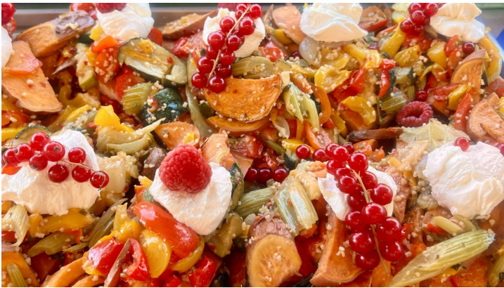
Fischkutter Flipper