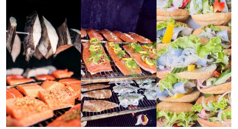
Fischkutter Flipper