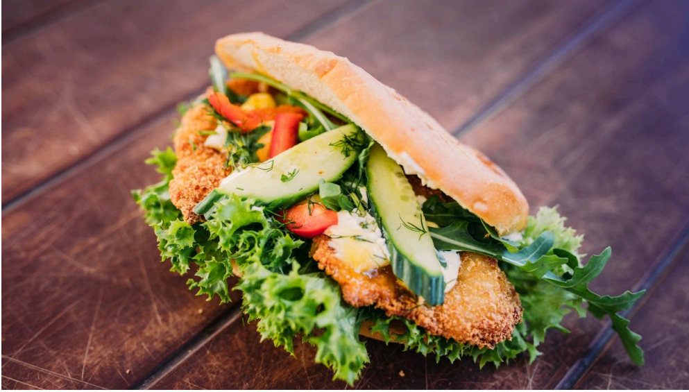
Fischkutter Ocean II