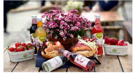
Fischkutter Ocean II