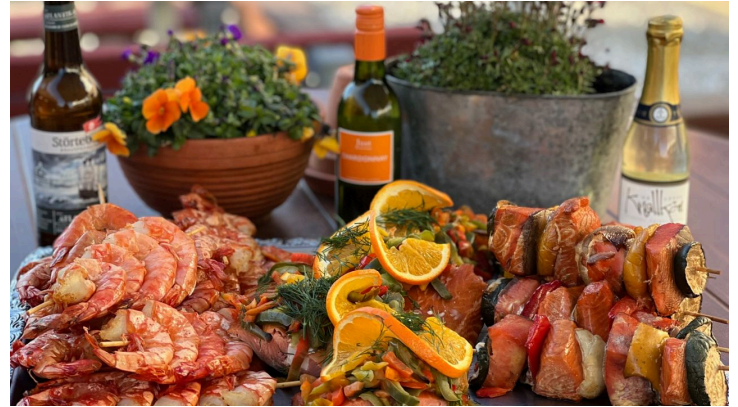
Fischkutter Ocean II