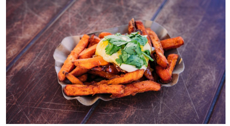
Fischkutter Ocean II