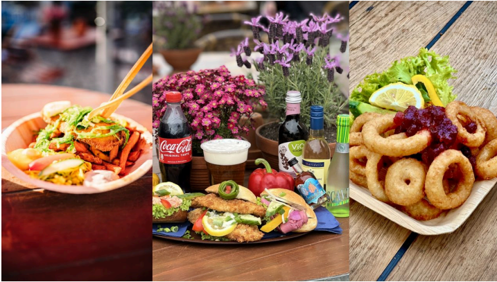
Fischkutter Ocean II